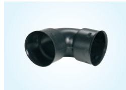
KULMA 110, 2 KPL