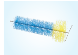
KARKEASUODATIN T-HAARAAN, 1 KPL

Suodatuskaseteilla voidaan toteuttaa myös laajempia kohteita. Laajemmissa järjestelmissä ota yhteys Pipelife Ympäristö -kumppaneihin.