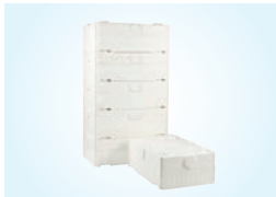
SUODATUSKASETTI, 6 KPL