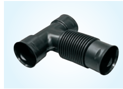
T-HAARA, 1 KPL