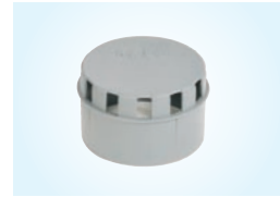
TUULETUSHATTU, 2 KPL