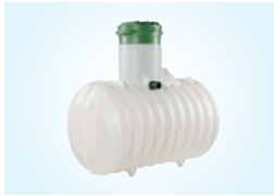
3010-ESISELKEYTYSSÄILIÖ, 1 KPL