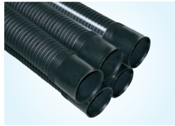
KOKOOMAPUTKI 110, 6 KPL