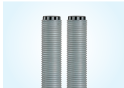
TUULETUSPUTKI 110, 2 KPL